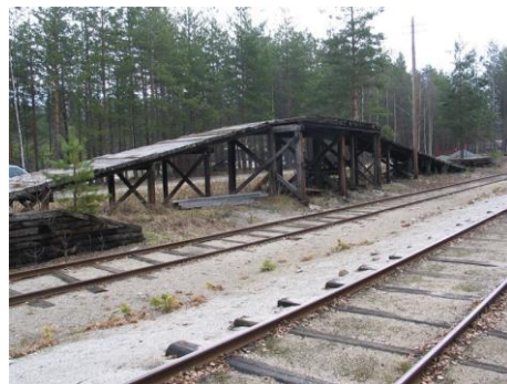
Tømmerrampa på Kløftefoss som venneforeningen ønsker å sette i stand

Sparebankstiftelsen DNB har i hvert fall bevilget 300 000 kr til prosjektet. En meget god start. Så håper vi at vår lokale bank og Gjensidigestiftelsen kan bidra med resten.