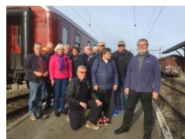
Krøderbanens venner på tur