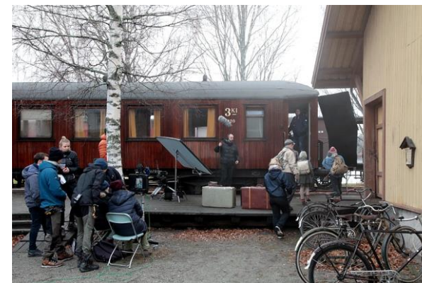
Opptak av film på Krøderen stasjon.