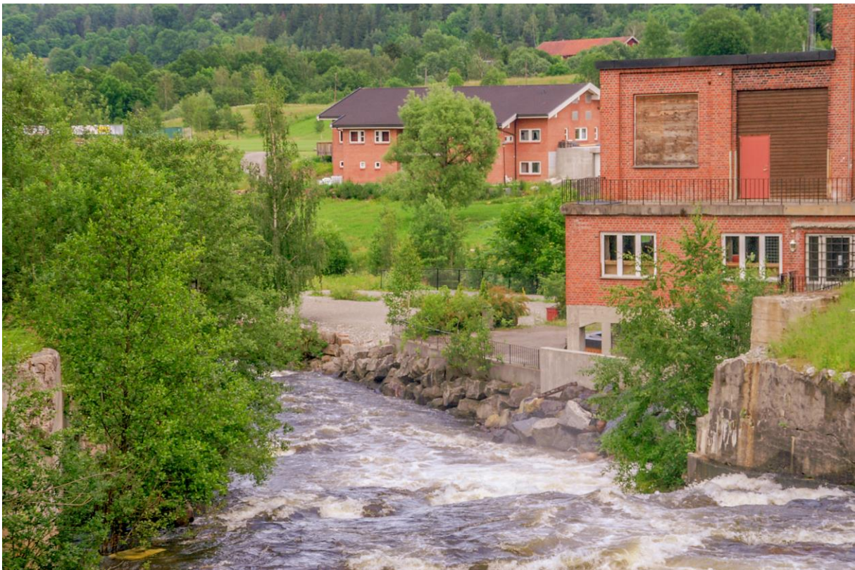
Vestfosselva i viltre kast forbi gammel industribebyggelse. (LHR)

Turen går denne gang til Øvre Eiker Kommune like vest for Drammen. Første stopp (ca. 12.30) blir besøk hos Norsk Motorhistorisk Senter på Burud, som har utviklet seg til å bli en av de store møteplassene for veteranbil- og veteranmotorsykkelinteresserte for hele Østlandet. Hver onsdag og helger i sommersesongen pleier det å være treff her. Denne lørdagen blir vi eksklusivt tatt i mot for å se på museet som er bygd opp av nostalgiting gjennom mange år. Enkelte modelljernbanerelaterte ting finner vi også, kanskje med vekt på hva man kunne finne i en lokal hobbybutikk, jernvare eller fargehandel «den gang vi var små». Vi regner med en times opphold her.