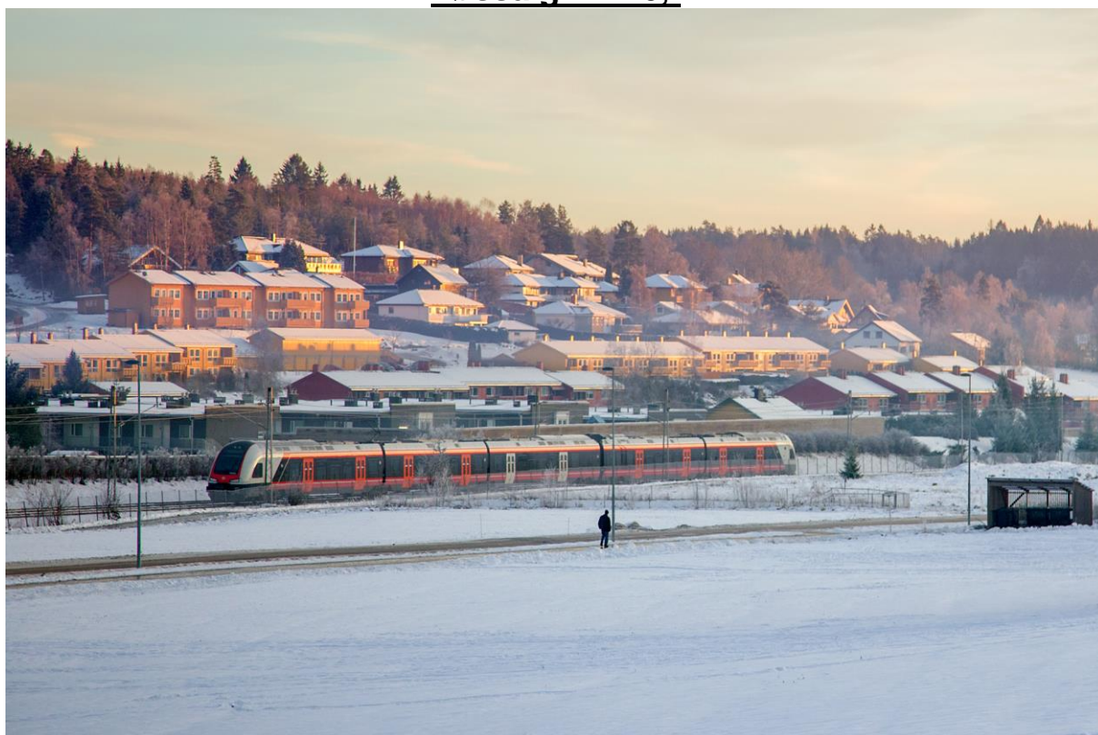
Lav vintersol over Hogstvedt ved Ås 28.12.2018.

Første viktige dato i 2019 er årsmøtet. Mer info inni bladet!