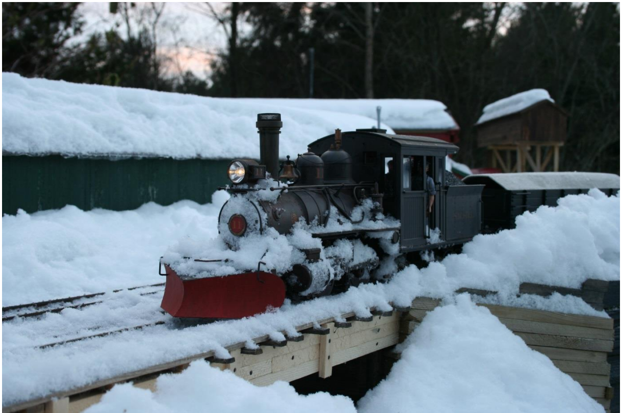
Over: Forney ved innkjør til Falsum st. Under: Consolidation under tømmerkran.