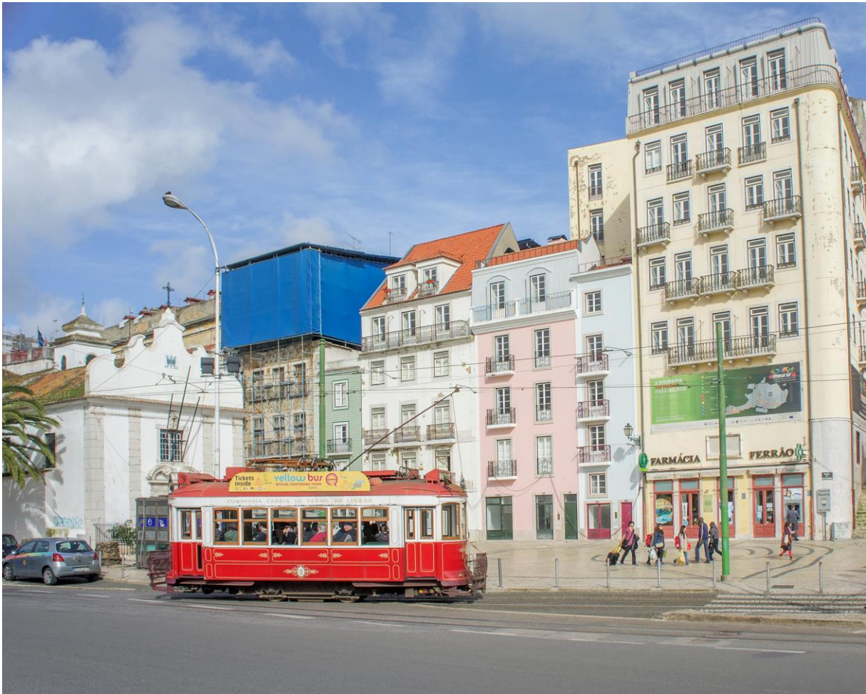
En vakker vårdag i Alfama-strøket (LHR)