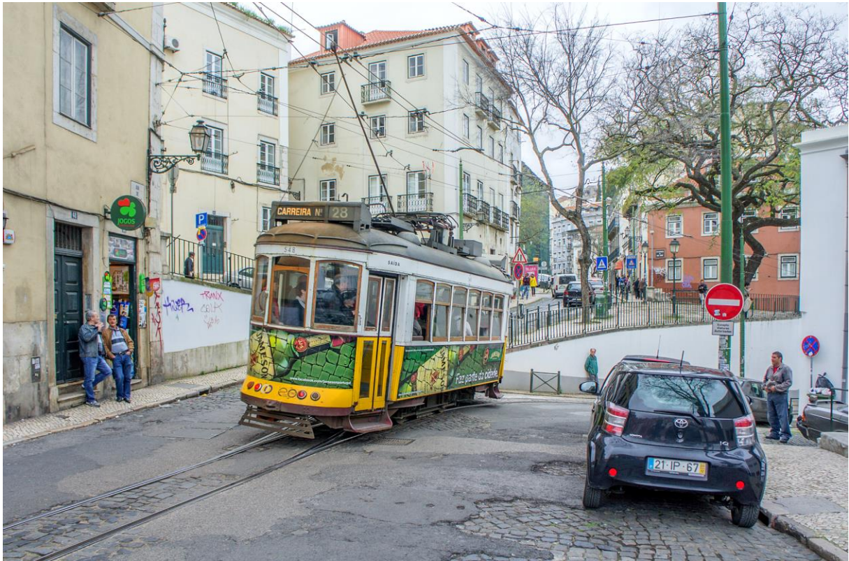
«Remodelados» i både gamle og nye omgivelser (LHR)