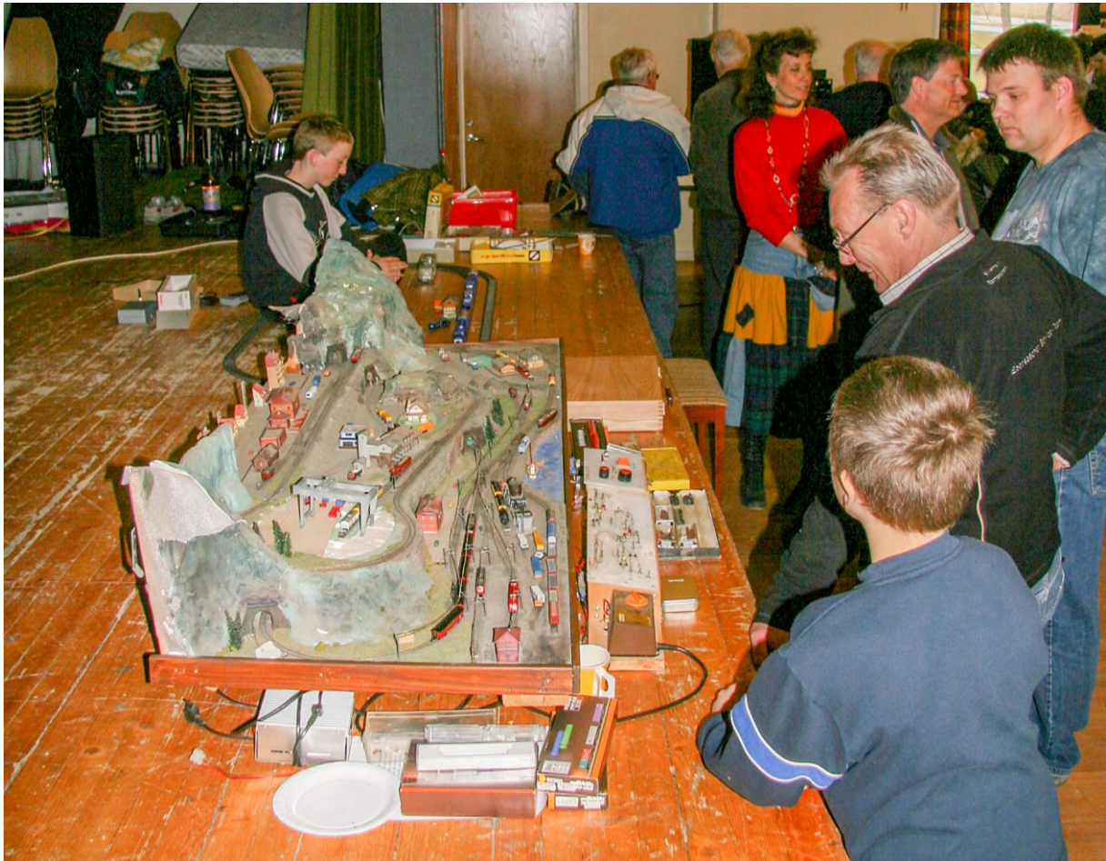
Messestemning i 2008 (over) og 2014 (under).