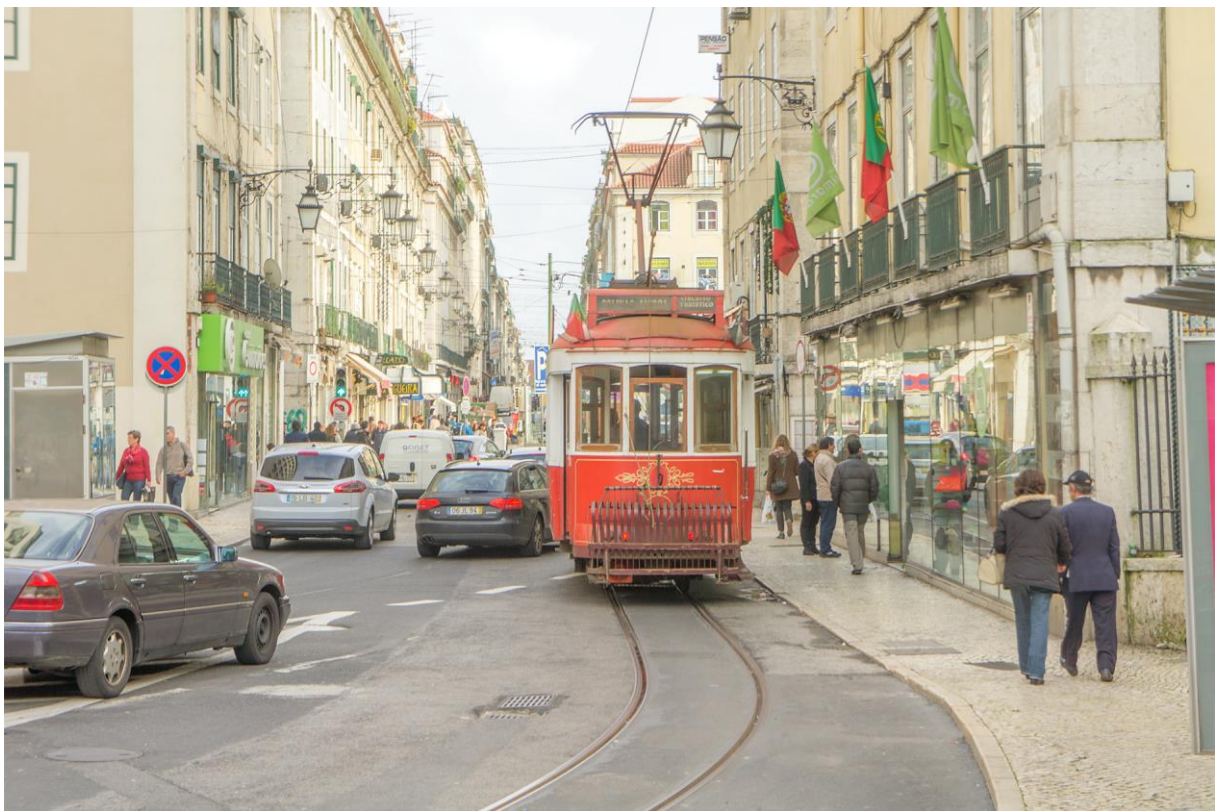
En «remodelado» er på vei fra Alfama-distriktet i retning Sentrum. (LHR)

Dersom man har draging mot trikkebyer verden over, er Lisboa et «must», og i tillegg har jo byen så mye annet å by på. Som hovedstad i et tidligere kolonivælde finnes mye interessant historie, og fra enda eldre tider er det også flere spor etter romerne i byen. I tillegg har Lisboa et stort omland med severdige steder som Cascais, Estoril og Sintra, så det er bare å kaste seg over reisehåndbøkene!