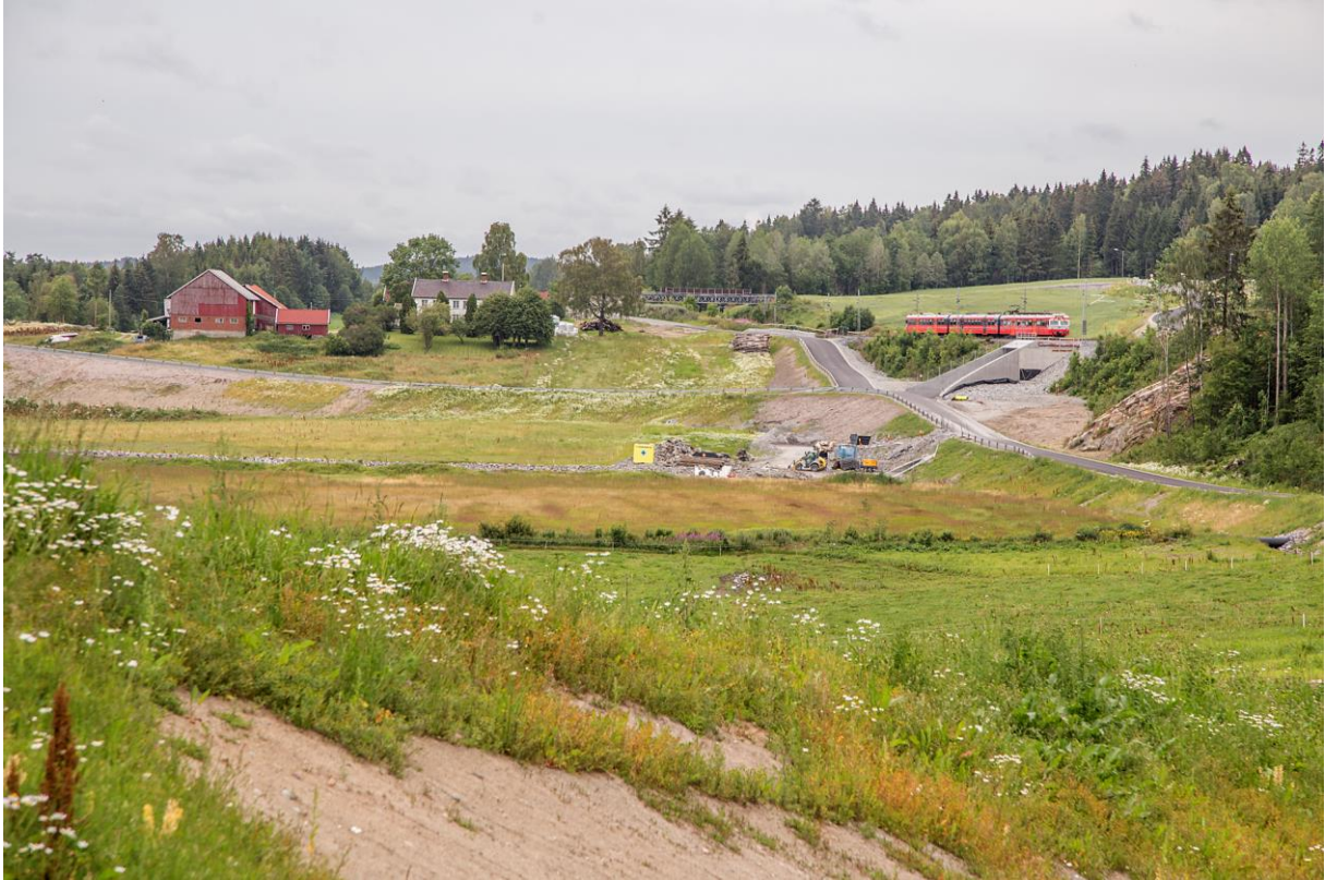
Kulturlandskapet mellom gårdene Roås og Endsjø har gjennomgått store forandringer det siste året.