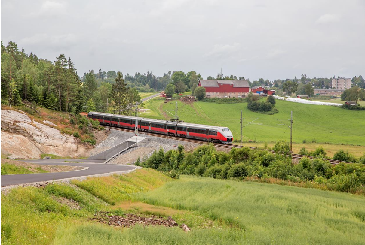
Tog 120 Halden Oslo krysser anleggsveien mellom Roås og Ski 25.07.2015

De fleste som frekventerer Ski-området regelmessig vil ha fått med seg de store endringene som har skjedd mellom Langhus og Ski som følge av arbeidene med det nye dobbeltsporet. Dermed har det også blitt mulig å fotografere jernbanelinjen fra nye og uvante vinkler, selv om gamle dagers idyll nok har blitt borte.