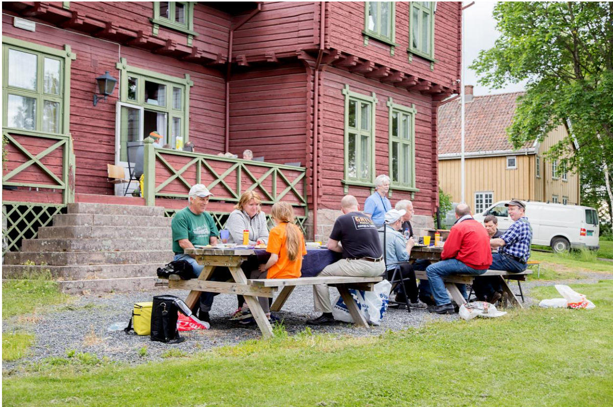
Været var samarbeidsvillig Sankthansaften 2015!