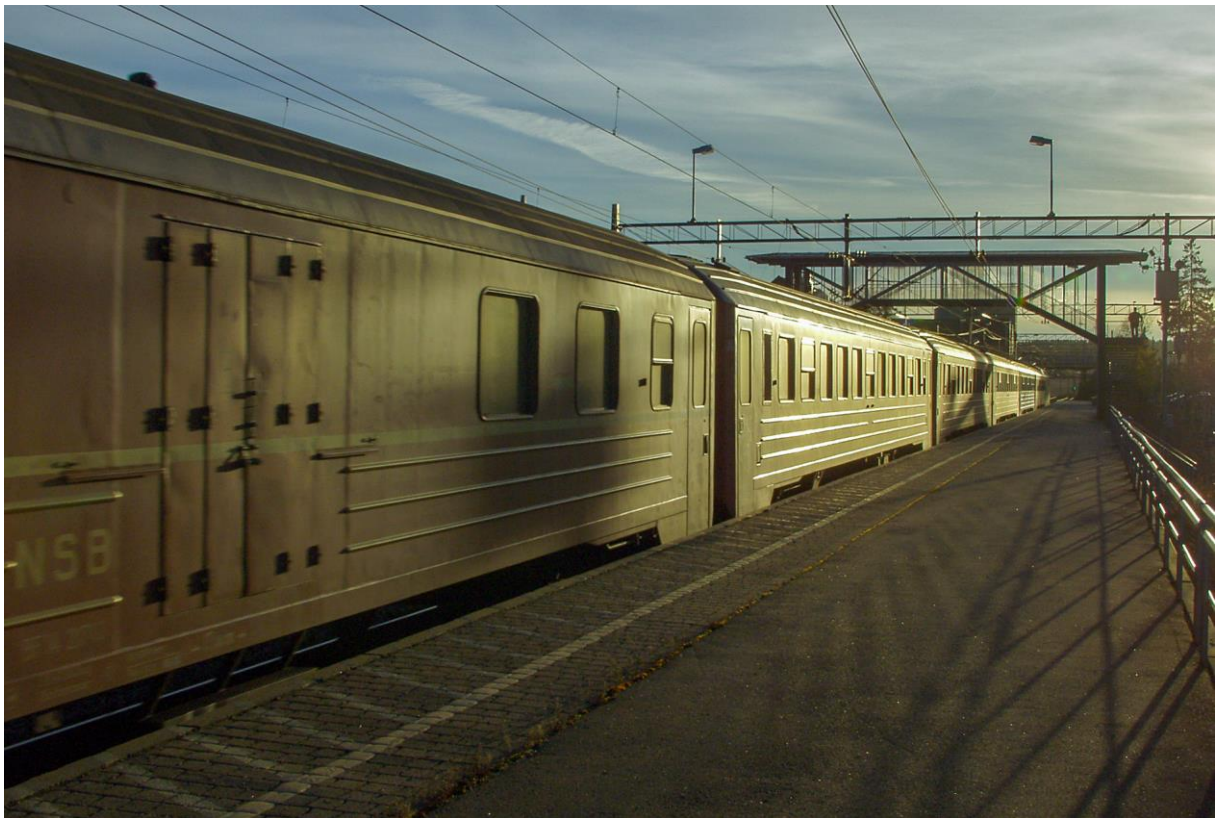
Red train in the sunset – på Vestby stasjon 24.10.2005.

Organ for Norsk Jernbaneklubb Lokalavdeling Østfoldbanen