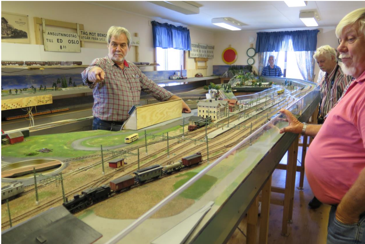
Over: MJ-klubben i Mellerud tok oss vel imot, og stilte med 6-7 mann denne lørdagen. H0-anlegget viser Mellerud st. (GWL) Under: Kulinariske tildragelser ved torget i Mellerud. (GWL)