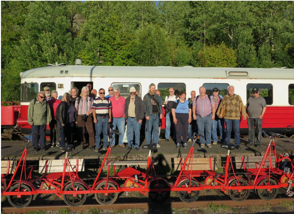
"Familiebilde" på perrongen i Bengtsfors i kveldssol. (GWL)