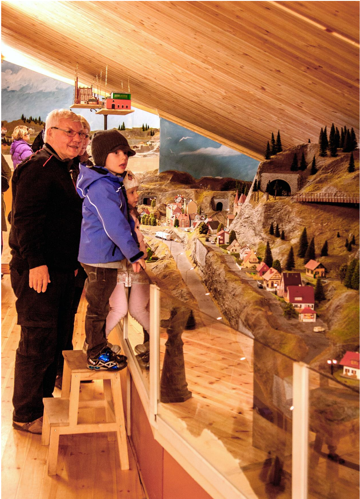
Vi unner oss et bilde til fra Modelljernbanesenteret i Gamlebyen. Begeistringen er å ta og føle på uansett alder, og hver kvadratmeter i den gamle bygningen er utnyttet med nennsom hånd. (LHR)